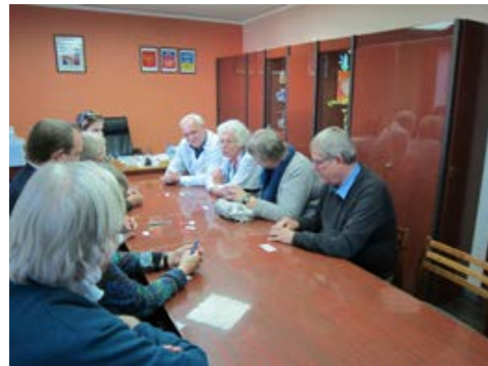
Kinderziekenhuis in Moermansk.