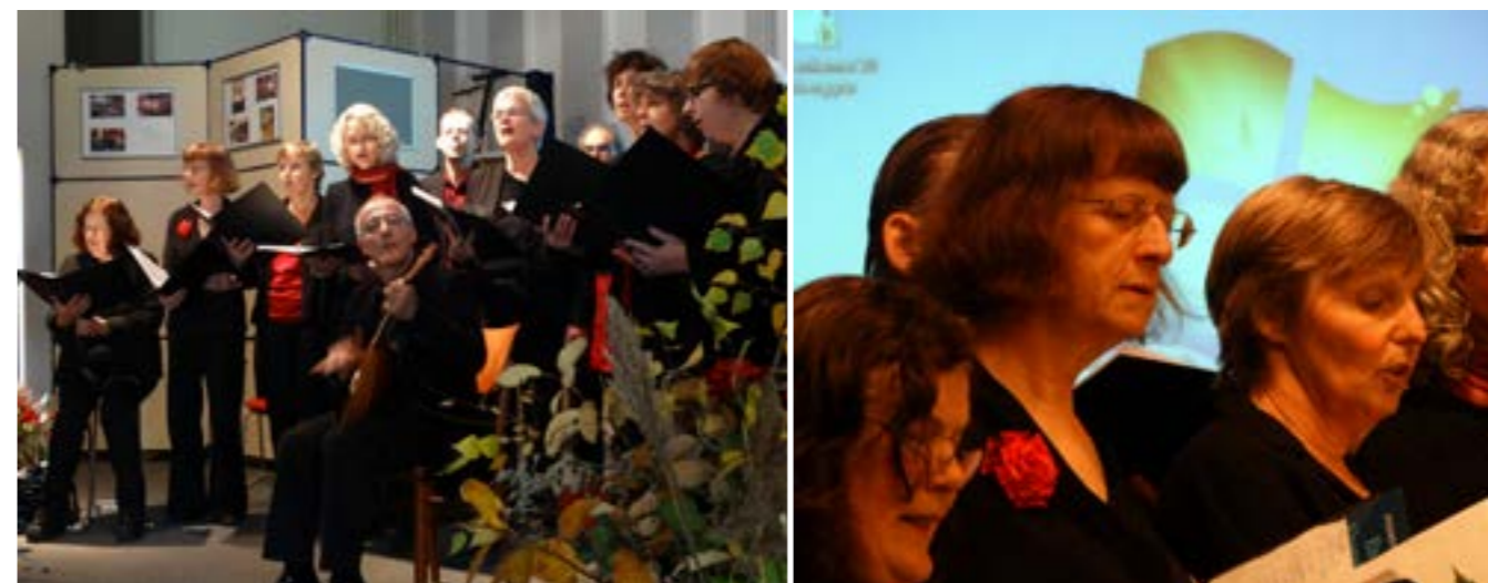
De sprekers werden afgewisseld met optredens van het koor Caucasica (Russische, Georgische en Armeense liederen, soms onder begeleiding van lokale muziekinstrumenten).