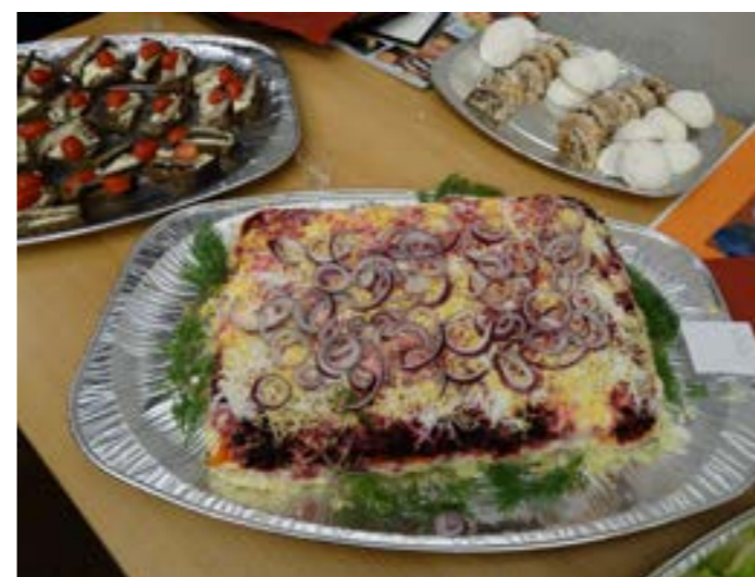
De Russische catering in de pauze en na afloop werd verzorgd door Ilona Cherepenova.