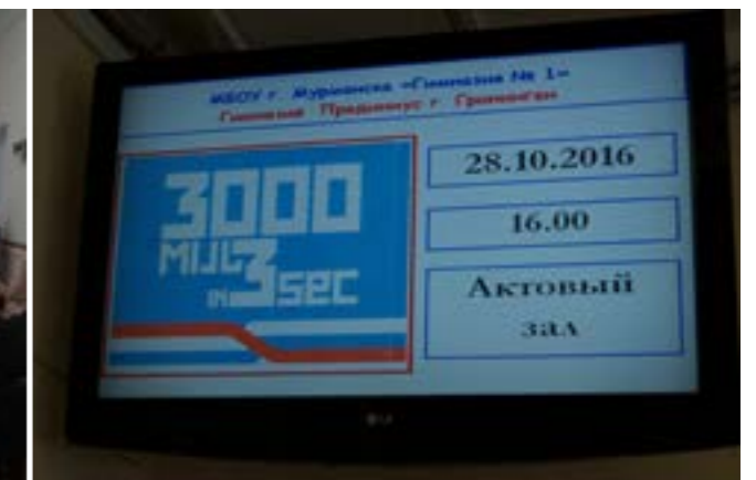
Bijeenkomst met Saami en Komi in Lovozero