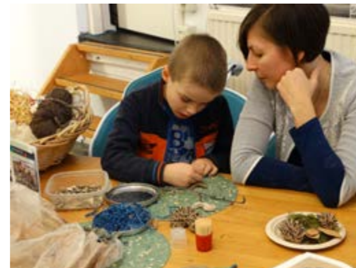
Kinderen konden onder leiding van bestuurslid Joyce Huisman (niet op de foto) Russische figuurtjes knutselen.