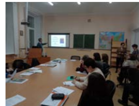
Opening van de conferentie

Tijdens de bijeenkomsten werden er verdere contacten gelegd voor een mogelijke wetenschappelijke samenwerking met de Universiteit van Groningen en het Mercator Centrum van de Fryske Akademy, waarbij in de toekomst door middel van uitwisseling van publicaties, nieuwe ontmoetingen, mogelijke stages en studieverblijven aandacht wordt geschonken aan problemen van meertaligheid, taalonderwijs en andere onderwerpen. Een concreet resultaat van de reeds bestaande samenwerking wordt gevormd door een speciaal Mercator Dossier over het onderwijs in de talen van de Nenets, Khanty en Selkup in het gebied Jamal van de Russische Federatie.