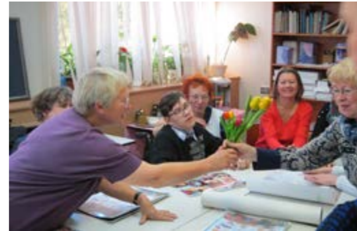
Bij Nadjezda – vereniging voor en door ouders van kinderen met een beperking.