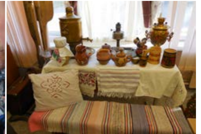
Bij Gymnasium No. 1, zusterschool van het Praedinius Gymnasium. Leerlingen beheren hier zelfstandig een schoolmuseum met typisch Russische gebruiksvoorwerpen.