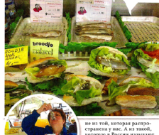
не из той, которая распространена у нас. А из такой, которую в России называют по-прежнему французской, т. е. с некоторыми германскими влияниями. Приятно мне сказать, что это не просто типично голландский, а даже типично европейский суп. Для любителей супов-пюре рекомендую этот вариант. Приятно мне сказать, что это не просто типично голландский, а даже типично европейский суп. Для любителей супов-пюре рекомендую этот вариант.

Пюре из картофеля и моркови. Это не только вкусно, но и полезно. Картофель и морковь – это те продукты, которые содержат много витаминов и минералов. Кроме того, это очень сытные продукты, которые помогут вам пережить зиму.