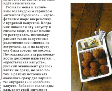
Ну а теперь про десерт, гордость голландцев – стروуфли. Они, как вы знаете, много путешествующая по всему миру, и даже в Голландии их можно приобрести совсем недорого, и даже в виде пюре. Но после того как мне довелось отведать свежесделанные вафли, я почувствовала их отличие от магазинных. Мелкий десерт продавался и в одной упаковке, и в виде вафельных пельменей. Мелкий десерт продавался и в одной упаковке, и в виде вафельных пельменей.